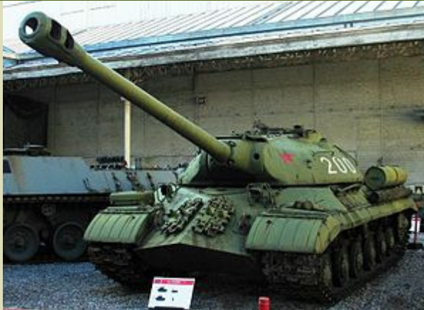
ИС-3 в музее Брюсселя