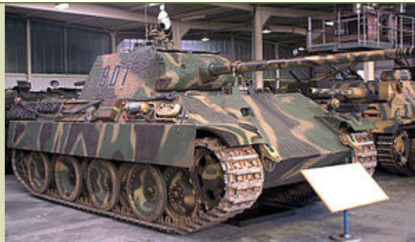
«Пантера» Ausf. G