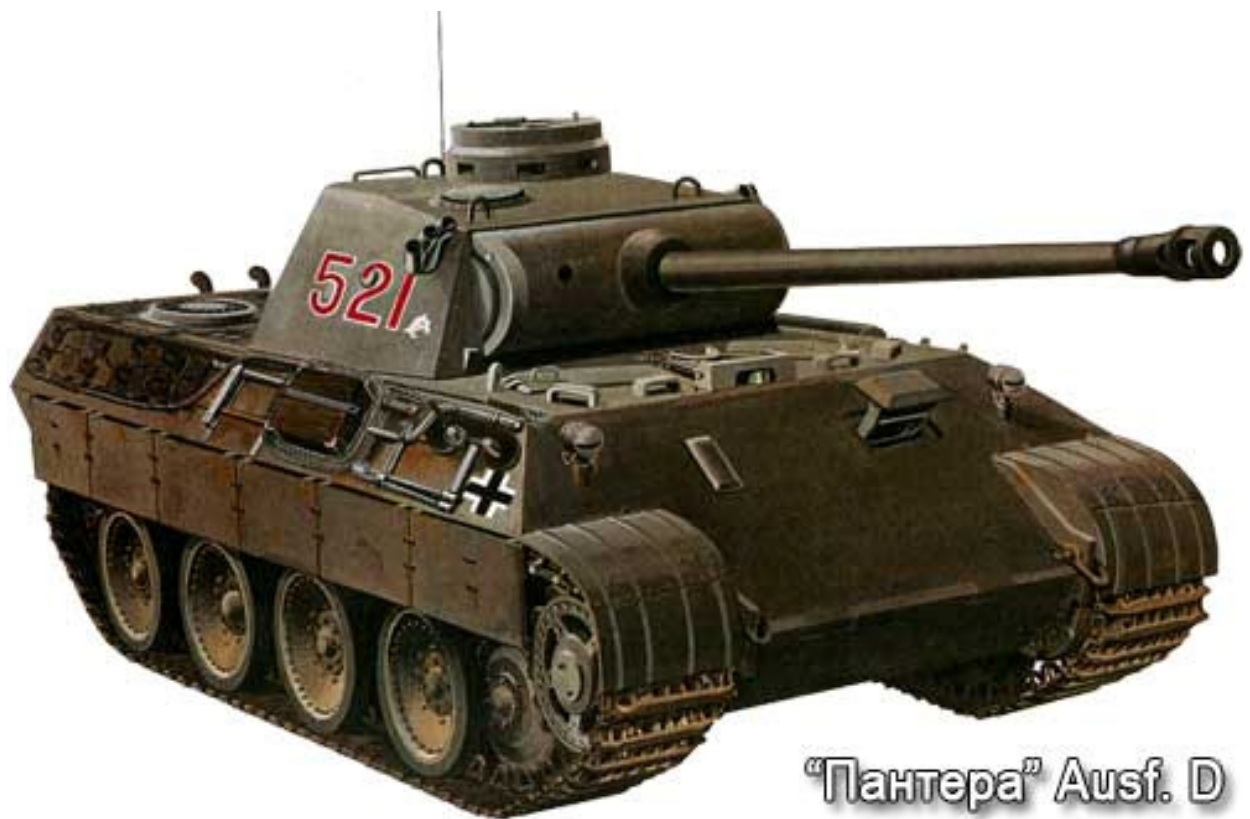
“Пантера” Ausf. D